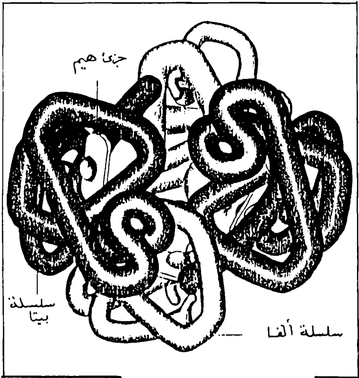
تركيب جزىء الهموجلوبين البشرى وشكله عند الطى