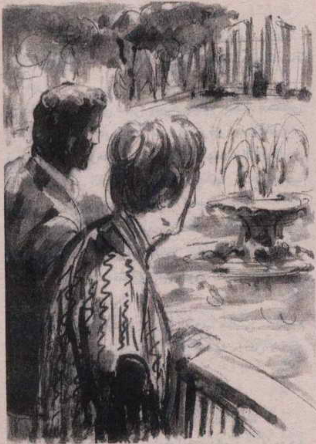
نترك المطبخ ونتجه للفناء الخلفى نرمق نافورة المياه ..

وأولادى لا يعرفون حقيقة ما عندى من مال .. هم يعرفون طبعاً أن زوجى ( توماس ) مات تاركاً لى مائة ألف من الدولارات .. لكنهم يجهلون كل شىء عن ( أطلانطا ) .. لقد جاء المال من زوجى الثانى ( تونى ) .. لقد مات منذ عامين .. وقبل موته بيومين مات أخوه الثرى المجنون ، وورث ( تونى ) الثروة .. ثم بعد يومين صرت وارثة لهذه الملايين .. « نترك المطبخ ونتجه للفناء الخلفى نرمق نافورة المياه ..