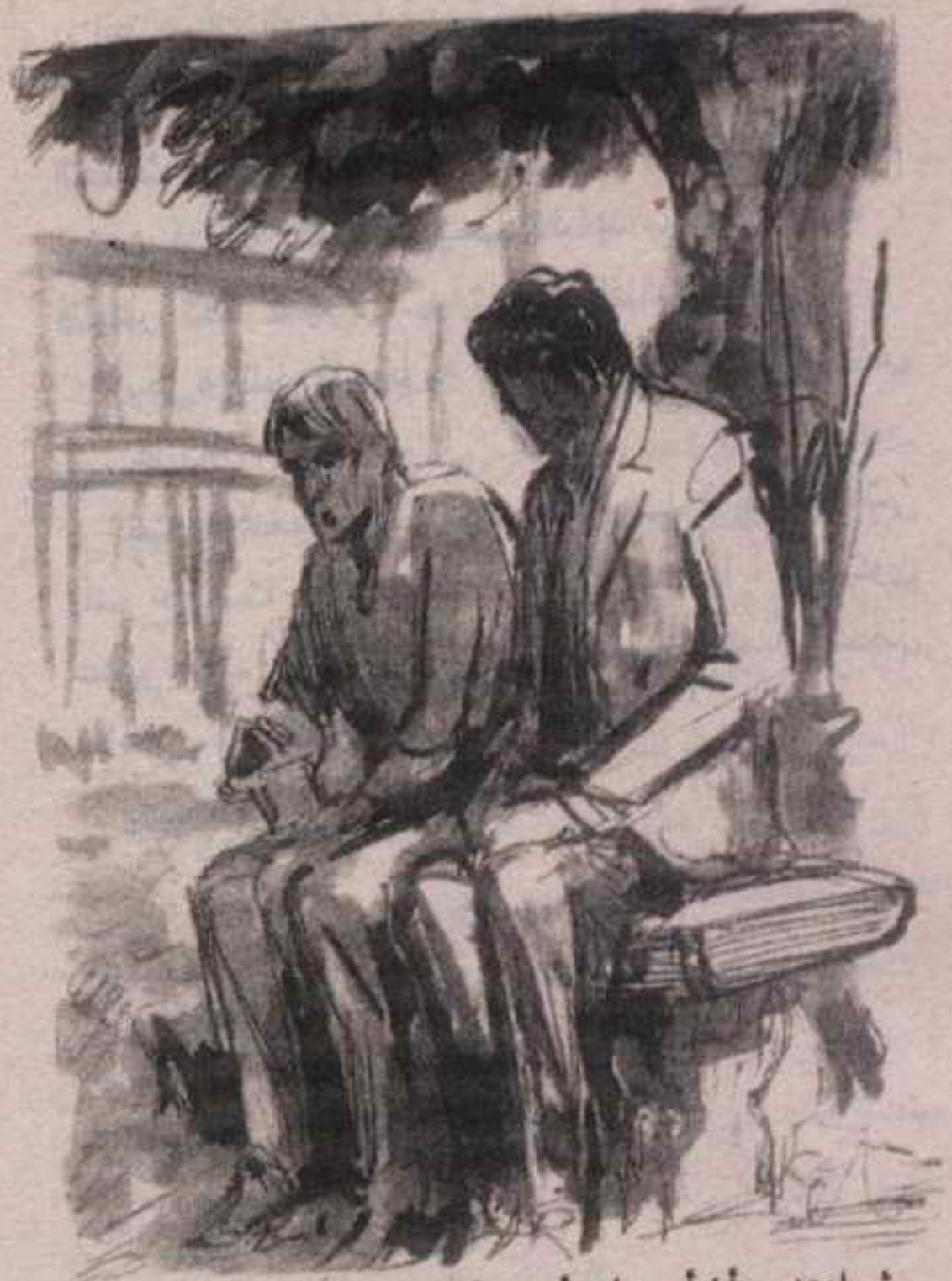
ثم اعتدت أن أمر عليه أسبوعياً لنشاهد مباريات الكرة ، فنجلس تحت شجرة ..

- « سعادتكم .. كنا منشغلين بجمع الأدلة والحقائق .. أما الآن فنحن نطلب ذلك .. »