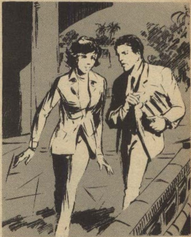
ووقع بصره على ( سلوى ) التي أسرع نحوه وسألته بلهفة ..

أمسك ( رمزي ) بأحد الكتب ، وقال : — لقد كانت الورقات الناقصة تحتوي على رسوم بالفعل .. رسوم وضعها بعض المعاصرين للشخصيات التي تتحدث عنها الكتب .. انظري هذا الكتاب عن ( يوليوس قيصر ) ، وهذا هو الرسم المفقود من النسخ