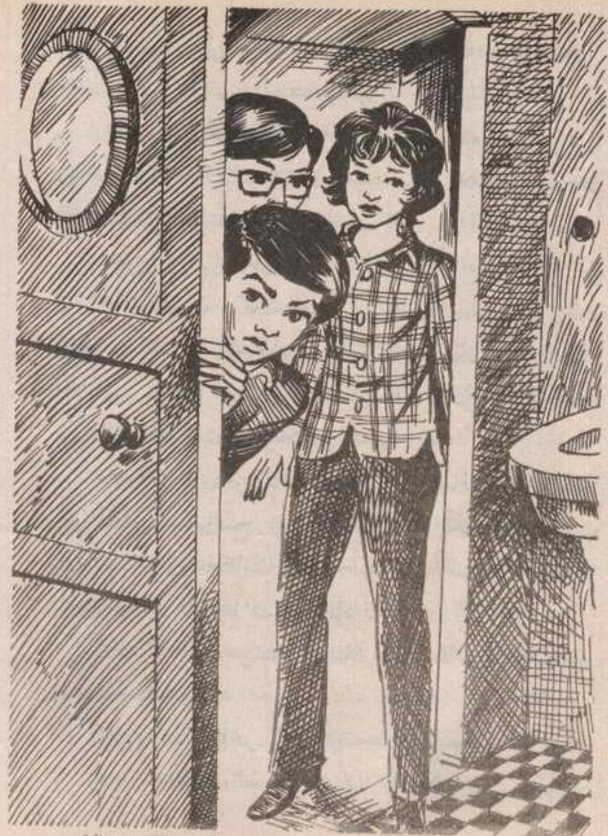
اندفعت « فلفل » تفتح الباب . . . فتفجئ الثلاثة بالحجرة خالية

سار الثلاثة عائدين إلى قاعة الطعام وهم يتبادلون التساؤلات