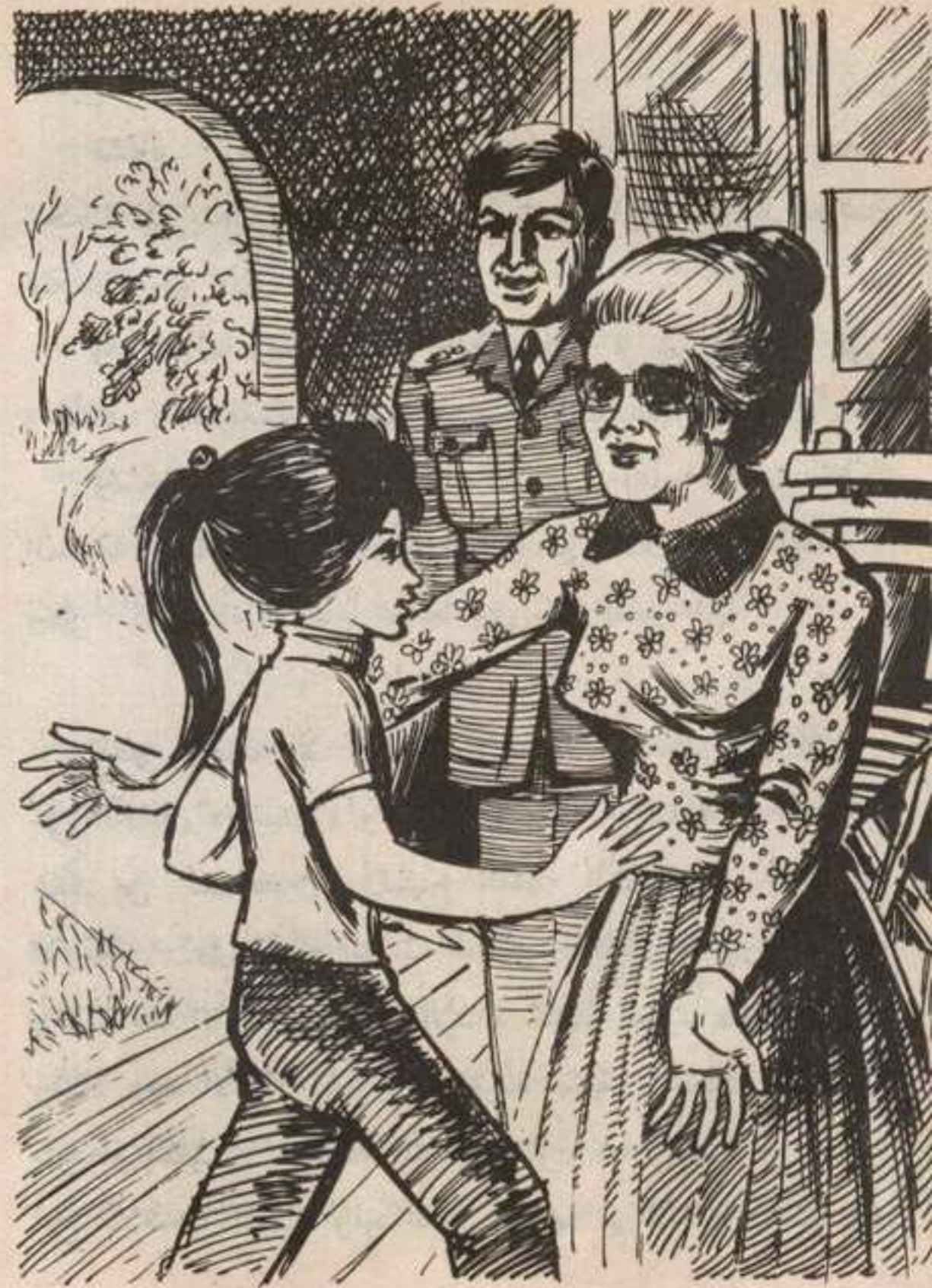
كانت السيدة « بشرى » سيدة مسنة ، نحيفة القوام ، متوسطة الطول

السيدة « بشرى » : إن كل ما أعرفه هو أن والدك بقلبه الطيب وثقته السريعة بالناس ، قد وقع في براثن عصابة من المحتالين اشتركوا معه في أول الأمر في عدد من عمليات الاستيراد