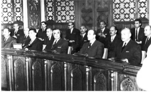
ضمن الوفد المصري المرافق للرئيس جمال عبد الناصر أثناء زيارته للهند يوم ٢١ أكتوبر ١٩٦٦، وفي الصورة يظهر عبد الحكيم عامر، أنور السادات، زكريا محي الدين، حسين الشافعي، صلاح نصر