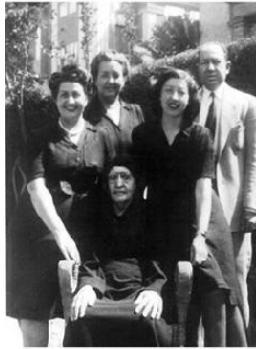
صورة تجمع جدي لوالدي ووالدي وحالي وخلالها في منزل العال بالقاهرة ١٩٤٩