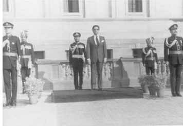
مستخدماً لتحصنات حرس الشرف ضمن مراسم اعتمادي سفيراً بالهند