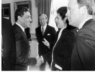
مصافحًا زوجة إسحق رابين عام ١٩٩٣ بعد توقيع اتفاق أوسلو في حفل أقيم في البيت الأبيض لهذا الغرض، ويّري وأارين كريستوفر في الصورة