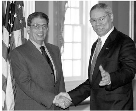
مع كولين باول في وزارة الخارجية الأمريكية