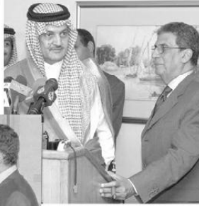
مع السيد سعود الفيصل في وزارة الخارجية بالقاهرة