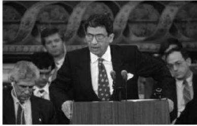
محدثاً أمام مؤتمر مدريد في ١٣ أكتوبر ١٩٩١