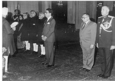
مستخدماً إلى خيابة الرئيس الهندي أثناء تقديم أوراق اعتمادي سفيراً في نيودلهي