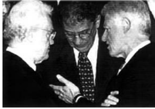
مع نيبيل كليتون رئيس الاليات المتحدة وليوئيل حوسبان رئيس وزراء فرنسا في أحد اجتماعات الجمعية العامة للأمم المتحدة