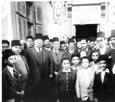
مع الجد في إحدى المناسبات الاجتماعية بهيئة مرحوم