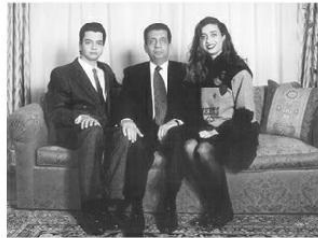
مع حامية وحازم في منزل العائلة عام ١٩٩٨