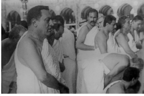
مع مبارك أثناء أداء مناسك الحج