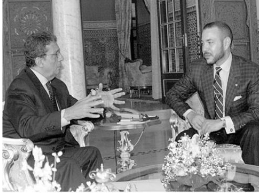
مع العامل المغربي الملك محمد السادس في الرباط