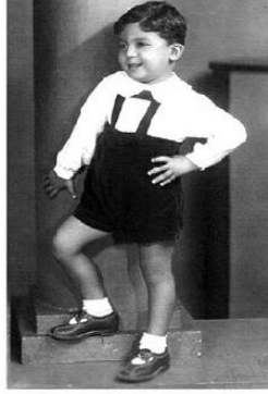
وأنا في الثالث من عمري