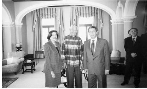
أنا ويلي مع الزعيم التاريخي نيلسون مانديلا في زيارتي لجنوب إفريقيا سنة ١٩٩٤