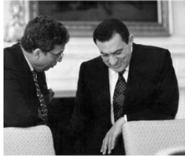
مع مبارك في البيت الأبيض قبيل الاجتماع مع الرئيس بيل كلينتون في إبريل ١٩٩٥