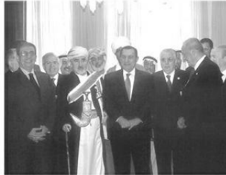
في إحدى جلسات البرلمان العربي التي حضرها الرئيس مبارك، ويحورون عبد الله الأحمر رئيس البرلمان اليمني وثيبه بري رئيس البرلمان الليبتي ورئيس برلمان الجزائر