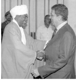
مع الرئيس السوداني عمر حسن البشير في الخرطوم