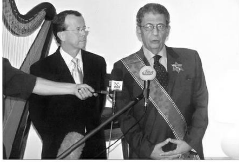
احظة تسلي وسلكا من ألمانيا في السفارة الألمانية بالقاهرة عند مفادري وزارة العلاجية ٢٠٠٦