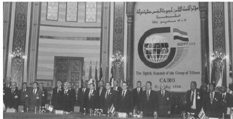
افتتاح اجتماع مجموعة الخمسة عشر الاقتصادية التابعة لحركة عدم الانحياز، مايو ١٩٩٨