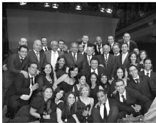
مع أبطال مسرحية «هجرة سادة» وفي الصورة الدكتور أبو الجند والمهندس إبراهيم المعلم والسفير هشام يوسف