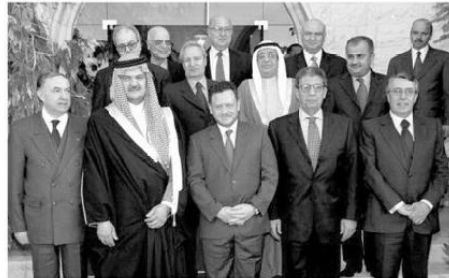
صورة تذكارية مع العامل الأردني الملك عبد الله بن الحسين وسعود الفيصل وزير الخارجية السعودية، ووزراء خارجية المغرب، الأردن، البحرين، سوريا، فلسطين، والأمين العام للجامعة العربية عصمت عبد المجيد في قمة عمان ٢٠٠٦