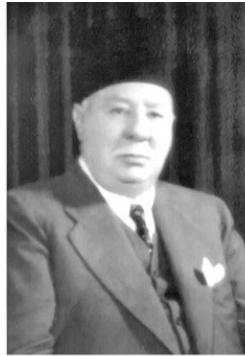
جدي السيد حسين الهويل (صورته الرسمية عسكياً في مجلس النواب ١١ نوفمبر ١٩٥٢)