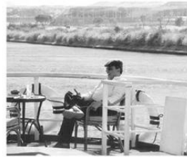
مستمتكا بإجازة في رحلة نابيلة بين القصر وأسوان