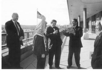
مع ياسر عرفات والمستشار التمساعي في وزعة الخارجية الأمريكية بفرقة مكتب وزيرة الخارجية مادلين أولبرايت