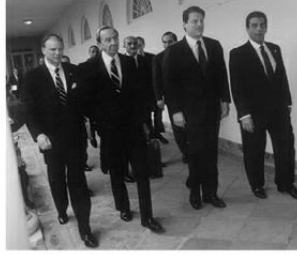
في البيت الأبيض، ويّري في الصورة آل جور نائب الرئيس الأمريكي، وأارين كريستوفر وزير الخارجية، واللواء عمر سليمان رئيس المخابرات العامة المصرية