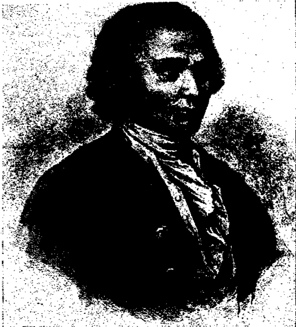
جان چاك روسو