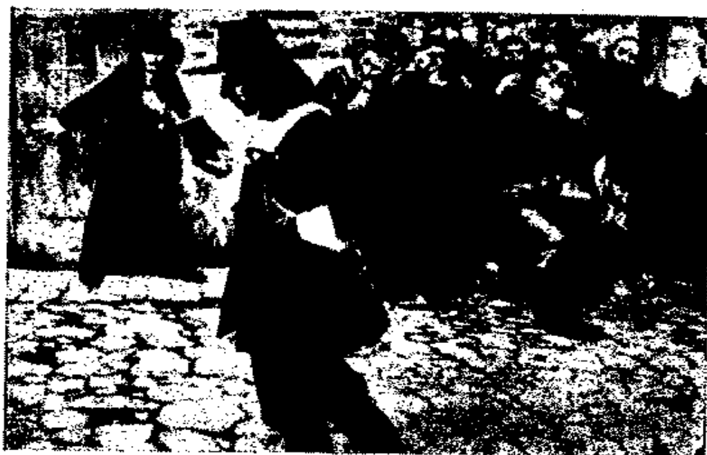
سييتوزا في الطريق ، منبوذاً من الناس