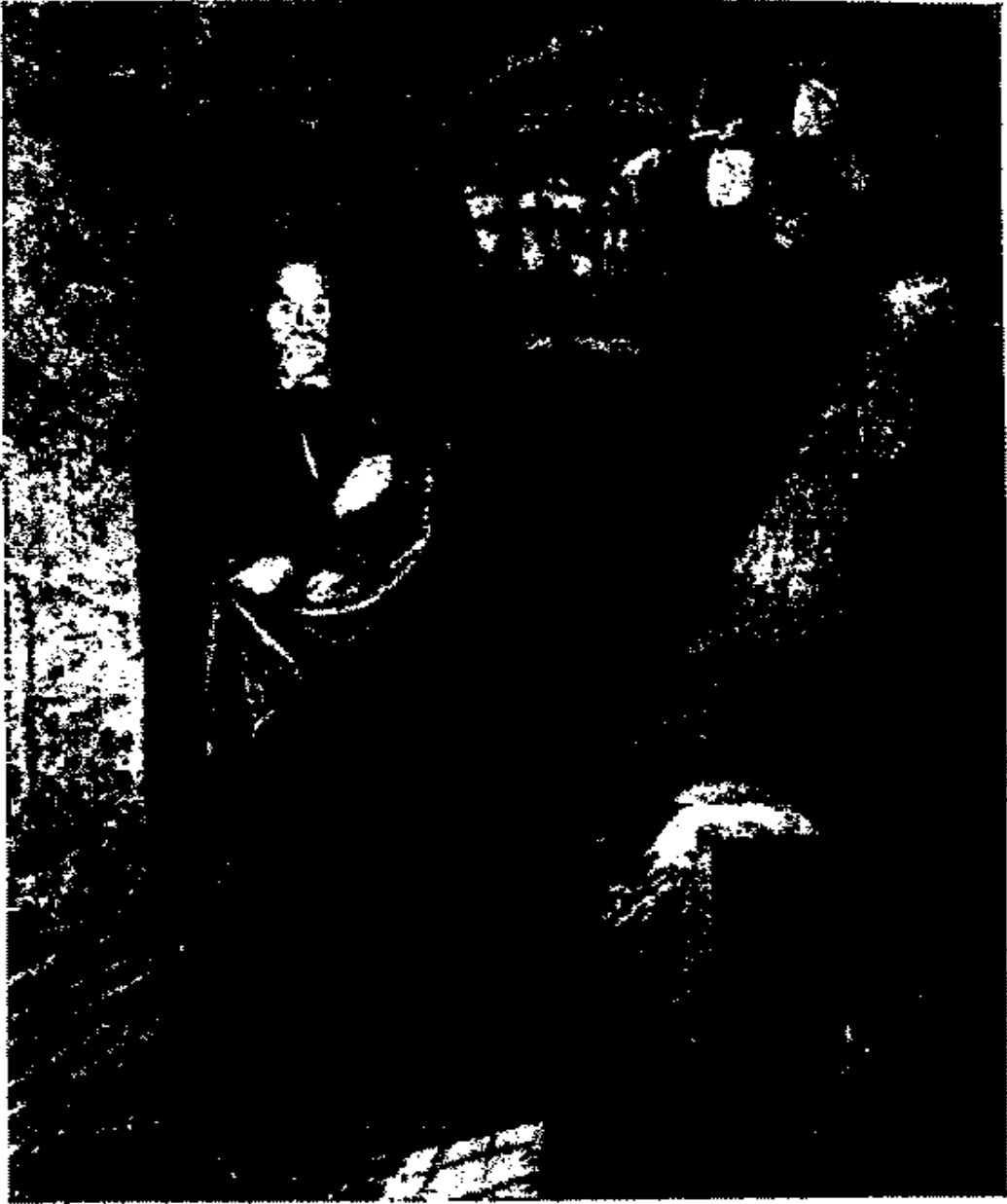
جاليليو في سجنه