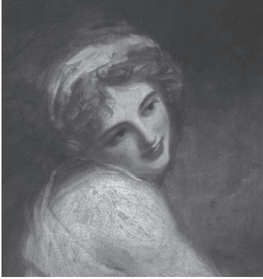
صورة اللادي هاملتون في زي عابدة باخوس إله الخمر.

الدنياوات إلا بضع درجات في ميزان الجو، ثم تتساوى الحماسة والحكمة، ويتجاوز العدم والوجود.