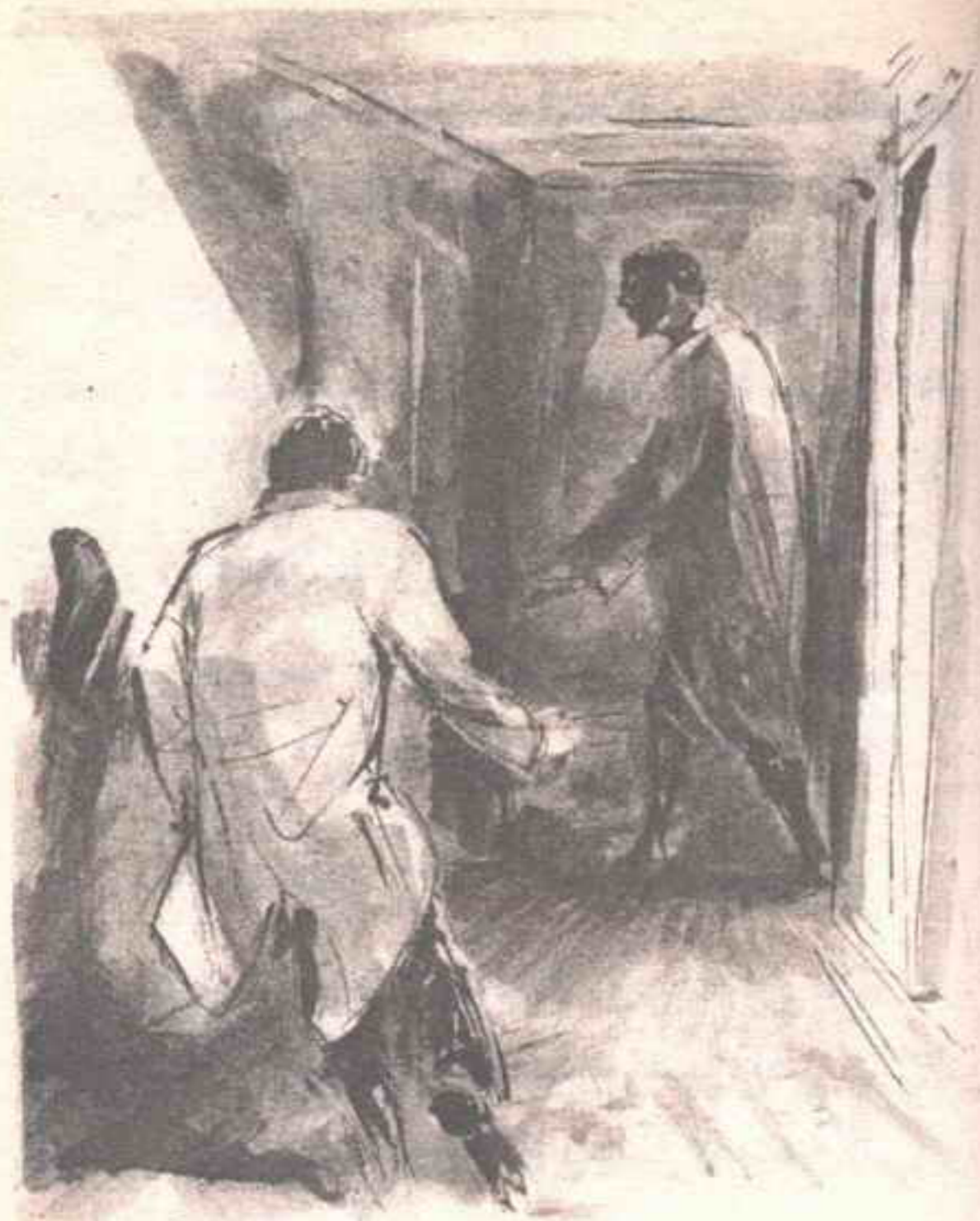
كان يمشى هناك في تودة ، ووجهه ميمما شطر نهاية الردهة ..