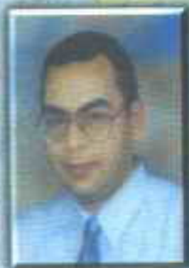
د. احمد خالد توفيق

انت تعرف هؤلاء الذين يهيمنون في الردهات ليلاً .. الذين يستحيل أن ترى وجوههم .. الذين يمشون في الظلال .. الذين لا يستديرون للوراء أبداً .. الذين يخفون فجأة ويعودون من حيث جاءوا !