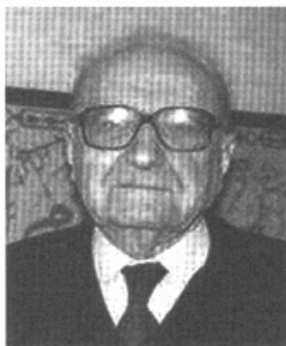
المفكر الفرنسي المسلم روجيه جارودي

(١) روجيه جارودي، مفكر وفيلسوف فرنسي، ولد في ١٧ يولية ١٩١٣ في مرسيليا بفرنسا، كان يسارياً شيوعياً معروفاً بتوجهاته المعادية للرأسمالية والتماشية مع المعسكر الشرقي، ثم اعتنق الإسلام عام ١٩٨٢ وألف عدة كتب عن الهولوكست والأساطير المؤسسة للكيان الصهيوني ومطامعه، وقد حكمت عليه محكمة فرنسية عام ١٩٩٨ بالسجن بتهمة التشكيك في محرقة اليهود في كتابه «الأساطير المؤسسة لدولة إسرائيل».