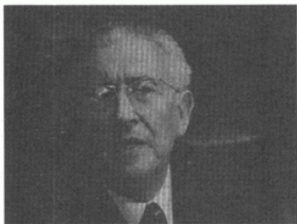
الجراح والمفكر الفرنسي المسلم موريس بوكاي.

الإسلام من باب المعرفة والحق واليقين، ويشبه في هذا أيضًا - وكان معنا في ملتقى الفكر الإسلامي - «روجيه جارودي» (١) الذي تسمى الآن «رجاء جارودي»، وعندما تحدثت معهم وأنا لا أعرف الفرنسية، ولكن كانت الترجمة تقوم مقام الجهل باللغة، وفي نوع من التلاقي في بعض المعلومات والكتابات عرفت أن إيمان هؤلاء الناس حقيقي، وأن معرفتهم بالإسلام صحيحة، وأنهم دخلوا الإسلام من باب البحث العلمي.