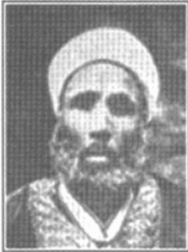
الشيخ بخيت المطيعي

يرى أن التصوير حرام، وبلغ التعصب لهذا الرأي حدَّ التماسك بالأيدي وربما الضرب؛ فقد ذهبت إلى الإسكندرية؛ لأفض بعض المشكلات التي نشأت عندما عرض رجل صوراً للمجاهدين في أفغانستان، وبعض ضحايا الهجوم السوفيتي هناك؛ فجاء من يقول له: التصوير حرام، ولا بد من تمزيق الصور.. فوقع الشابك والضرب.