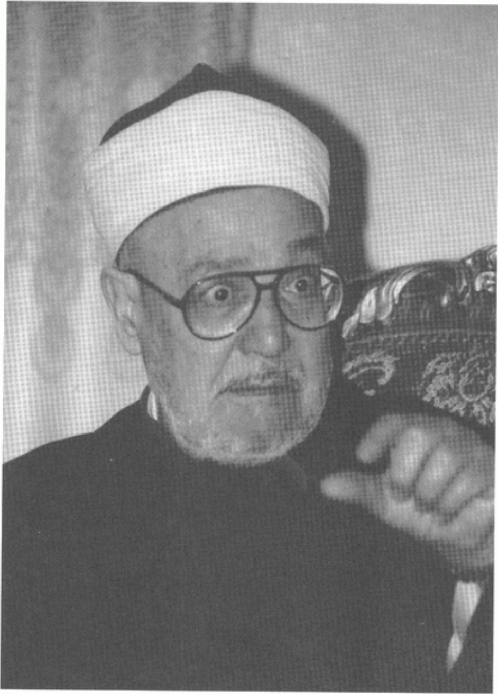
الشيخ محمد الغزالي