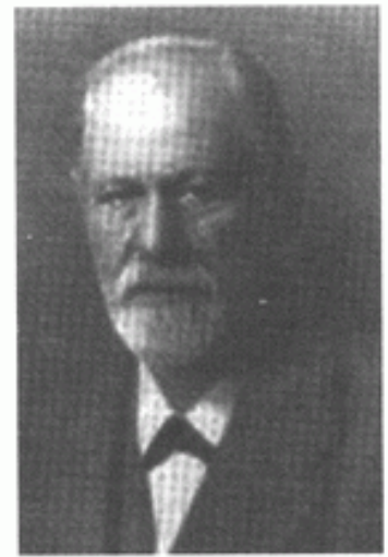
عالم النفس الشهير سيجموند فرويد.

أعتقد أن الدكتور الفرنسي الذي أسلم «موريس بوكاي» (١) كان من الذين أكدوا على هذا في مؤلفاتهم.. أليس هذا صحيحًا؟