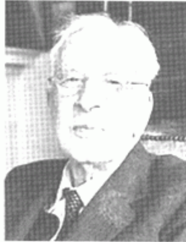
المؤرخ الإنجليزي توينبي صاحب كتاب